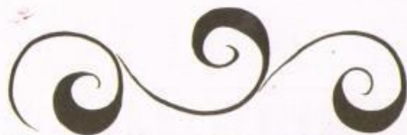
ВЕДУЩИЙ СТЕБЕЛЬ — «КРИУЛЬ»